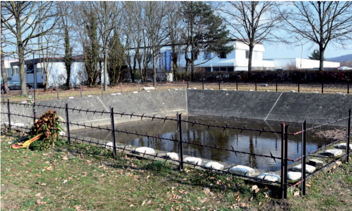
Der Löschteich, Ort und Symbol des Schreckens auf dem Gestapo-Lager Neue Bremm .

Lebens. Dies zeigt, dass wir unsere Verantwortung für die Erinnerung an die Verbrechen im Dritten Reich ernst nehmen.