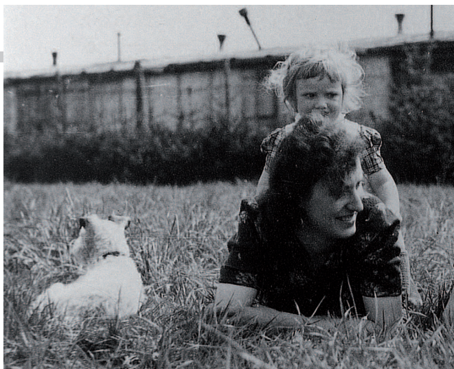
Vor aller Augen: Familienidylle mit Tochter und Hund vor dem Gestapo-Lager Neue Bremm, um 1943

Im Dritten Reich haben fast alle weggeschaut. In Saarbrücken vor dem Lager Neue Bremm , in Saarbrücken, als die Zwangsarbeiter zu den Arbeitseinsätzen durch die Stadt geführt wurden. Richtig, Zivilcourage konnte damals tödlich sein. Der in Saarbrücken aufgewachsene Willi Graf und die weiteren Mitglieder der Weißten Rose sind ein schlagendes Beispiel dafür, wie schnell die Kritik am Dritten Reich auf dem Schafott enden konnte.