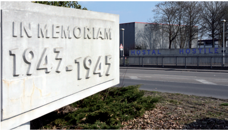
Tafel am Obelisk an der Metzger Straße vor der Gedenkstätte Gestapo-Lager Neue Bremm.

Wir erleben, wie der kalkulierte Tabubruch, als Fehlinterpretation entschuldigt, auch vor dem Leid und dem Schrecken der Opfer nicht Halt macht.