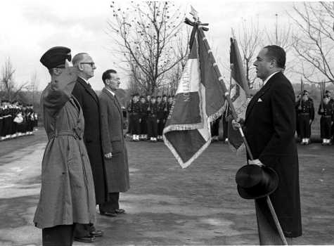
10) Verregnete Gedenkfeier mit Ministerpräsident Johannes Hoffmann (erste Hälfte 1950er Jahre)