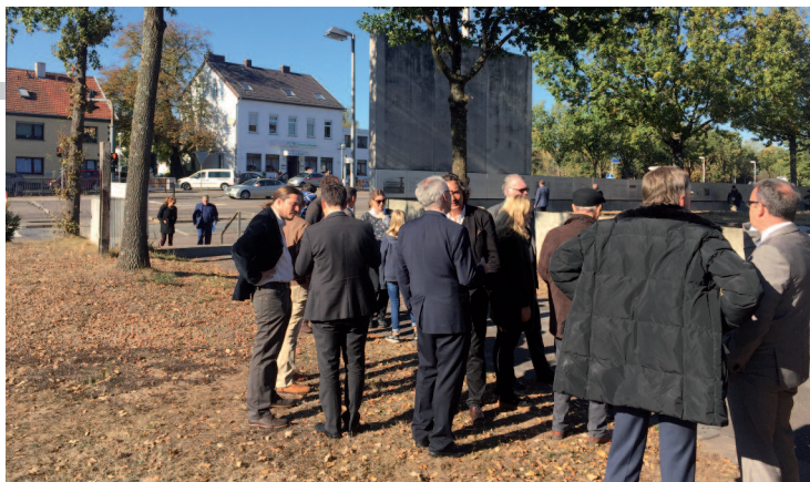
Ehrengäste bei der Besichtigung des Männerlagers anlässlich der Eröffnung des 4. Bauabschnitts der Gedenkstätte Gestapo-Lager Neue Bremm , hier mit Blick auf die Rückseite des Billboards und die Informationstafeln.

1940er Jahre das Gestapo-Lager Neue Bremm , durch das etwa 20.000 Menschen vor allem aus Frankreich in die NS-Vernichtungslager im Osten geschleust wurden. In Saarbrücken wurden sie oft über Monate gequält, ehe sie weitertransportiert wurden, viele von ihnen bezahlten die unmenschliche Behandlung durch die Nazis mit ihrem Leben.